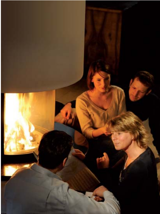
Bild Nr. 92397: Im Trend: Großformatige Kaminsichtscheiben aus der hitzebeständigen Glaskeramik SCHOTT ROBAX® halten warm und sicher.