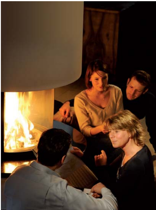
Photo N°. 92397: Tendance : les vitres d'observation pour inserts, poêles et cheminées, en vitrocéramique résistante à la chaleur ROBAX® de SCHOTT apportent de la chaleur en toute sécurité.

Lien pour télécharger un fichier ZIP avec la photographie en qualité imprimable : http://www.schott-pictures.net/presskit/92511.Robax-ISH-EN