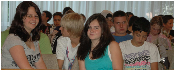
Bild 01: 225 Acht-Klässler aus 13 Hauptschulen der Region Stuttgart nahmen dieses Schuljahr an den Bewerbungs-, Knigge- und Motivations-Trainings der Wirtschaftsjuvenen teil.