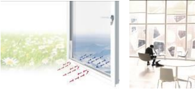
Foto 3 + 4: Distanziatori a bordo caldo come Thermix permettono una vetratura isolante particolarmente efficiente, come ad es. nel nuovo Student Learning Center della Ryerson University di Toronto in Canada.