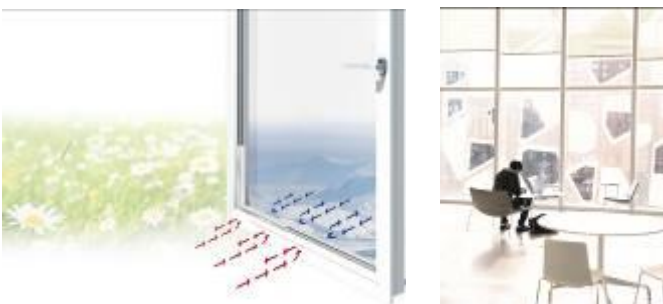
Foto 3 + 4: Warme Kante Abstandhalter wie Thermix ermöglichen besonders effiziente Isolierverglasung, z.B. am neuen Student Learning Center der Ryerson University in Toronto, Kanada.

Bilder in hoher Qualität: Download ZIP oder via press.info@oha-communication.com