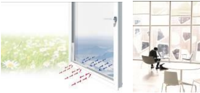
Foto 5 + 6: Warme Kante Abstandhalter wie Thermix ermöglichen besonders energieeffiziente Isolierverglasungen, z.B. am neuen Student Learning Center der Ryerson University in Toronto, Kanada.

Bilder in hoher Qualität: Download ZIP oder via press.info@oha-communication.com