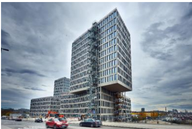
Abb. 1: Das KAP WEST in München (hier noch mit einer Behelfs-Außentreppe aus Brandschutzgründen am Südturm) wird Mitte 2020 komplett bezogen sein. Dekton® im Farbton »Keon« bekleidet die Fassade des urbanen Bürogebäudes.