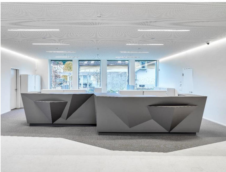
Abb. 1: Der Empfangstresen setzt ein Statement: Diese Bank bietet für individuelle Ideen ein solides Fundament.