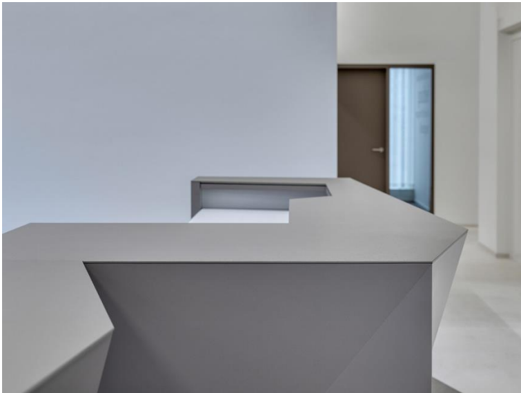
Abb. 3: Perfekt bündig liegt die Oberfläche aus Dekton® auf dem maßgefertigten Korpus auf.