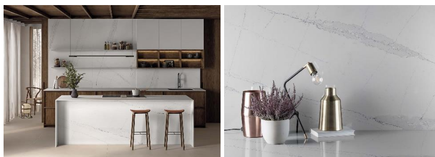
Fig. 2 : Silestone® Ethereal Dusk se caractérise par un look urbain, où la teinte bleutée de son veinage ajoute une touche moderne et avant-gardiste à l'espace. Fig. 3 : L'aspect de Silestone® Ethereal Dusk symbolise un lever de soleil unique, inoubliable et personnel, où le silence, la majesté et la tranquillité apparaissent à l'horizon dans les derniers instants de l'obscurité.