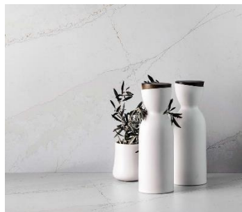
Fig. 6 : Silestone® Ethereal Glow est tout simplement l'élégance pure et classique. Le grain doré et gris se mêle au blanc chatoyant de la base, traverse tout le design et apporte un accent de couleur dans chaque coin. Fig. 7 : Silestone® Ethereal Glow s'inspire du coucher de soleil avec ses couleurs vives et son éclat - un spectacle dont vous ne pouvez détourner le regard. Il s'agit d'une évolution de notre couleur Silestone® Eternal Calacatta Gold, internationalement reconnue.