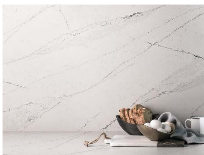
Fig. 8 : Silestone® Ethereal Noctis est synonyme de sophistication. Le ton de base blanc est interrompu par de courtes veines grises et noires qui apportent contraste, profondeur, simplicité et modernité. Silestone® Ethereal Noctis s'inspire du crépuscule après le coucher du soleil qui nous fait ressentir la vie, avec une étrange lueur d'irréalité.