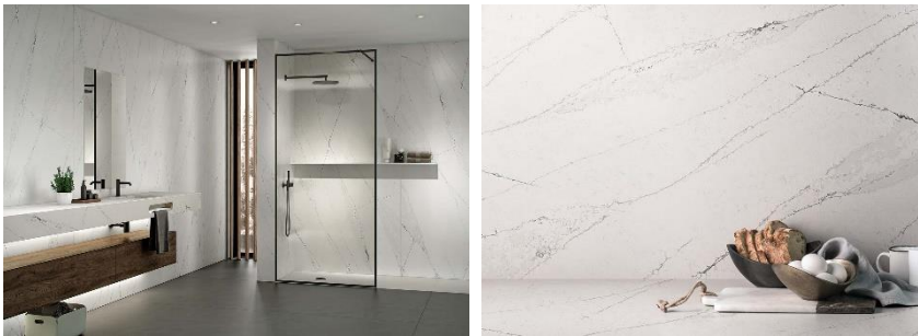
Abb. 8: Silestone® Ethereal Noctis ist ein Synonym für Raffinesse. Der weisse Grundton wird von kurzen grauen und schwarzen Adern unterbrochen, die für Kontrast, Tiefe, Einfachheit und Modernität sorgen. Silestone® Ethereal Noctis ist inspiriert von der Dämmerung nach Sonnenuntergang, die uns das Leben spüren lässt, mit einem seltsamen Schein der Unwirklichkeit.