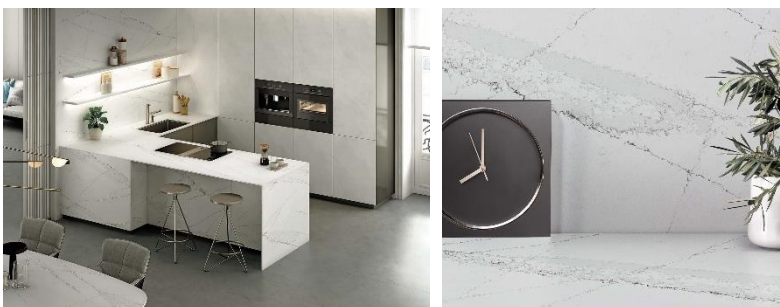
Abb. 4: Silestone® Ethereal Haze besitzt eine dynamische Palette von Grautönen, die viel Persönlichkeit ausstrahlen. Diese Farbe vermittelt sowohl Ruhe als auch Charakter dank eines Wechselspiels von Farbverläufen, die in reine Neutralität übergehen. Abb. 5: Silestone® Ethereal Haze entführt uns in eine imaginäre Welt, in der der Wind die Wolken über die Berge weht und eine optische Illusion von Leichtigkeit und Unbeschwertheit schafft.