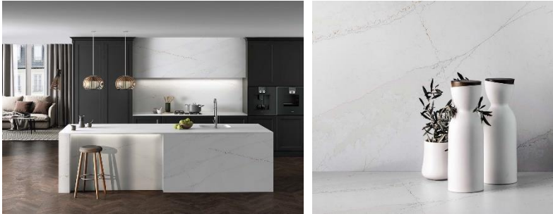
Abb. 6: Silestone® Eternal Calacatta Gold ist einfach pure, klassische Eleganz. Die goldene und graue Maserung verschmilzt mit dem weiss schimmernden Grundton, zieht sich durch das gesamte Design und bringt einen Farbakzent in jede Ecke. Abb. 7: Silestone® Eternal Calacatta Gold ist inspiriert vom Sonnenuntergang mit seinen glühenden Farben und seinem Leuchten – ein Anblick, von dem man nicht wegsehen kann. Es ist eine Weiterentwicklung unserer international gefeierten Farbe Silestone® Eternal Calacatta Gold.