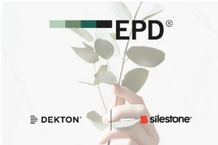
Abb. 1: Cosentino hat für Silestone und Dekton die Environmental Product Declaration (EPD) erneuert. Im Vergleich zur Vorgänger-EPD wurden deutliche Verbesserungen erzielt. EPDs weisen die Umwelteinflüsse eines Produkts über den gesamten Lebenszyklus aus.