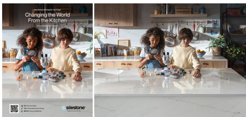
Fig. 1: "Changing the World From the Kitchen" è la nuova campagna per il Silestone®, formulato e prodotto in modo particolarmente sostenibile.