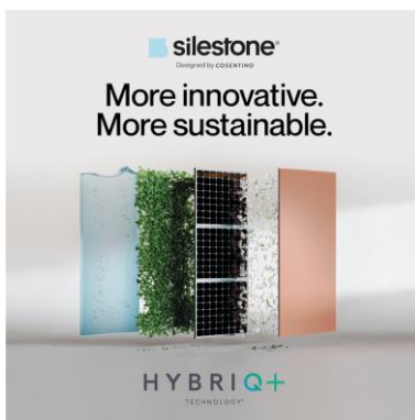
Abb. 2: Dank der innovativen HybriQ+®-Technologie ist Silestone besonders nachhaltig: Die Formulierung enthält vorwiegend hochwertige natürliche Mineralien wie Quarz und mindestens 20 % recycelte Materialien wie Glas. Produziert wird mit 99 % wiederaufbereitetem Wasser und 100 % Strom aus erneuerbaren Quellen.