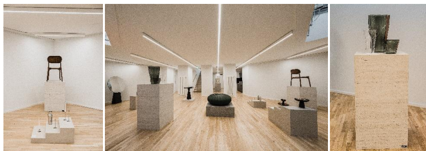
Abb. 6, 7, 8: „Die neue Serie Dekton Pietra Kode von Cosentino gibt uns die Möglichkeit mit minimalistischen Formen zu arbeiten, die das Material für sich sprechen lassen“,