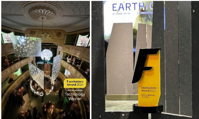
Abb. 1 und 2: EARTHIC® LAB, die Installation von Cosentino und Formafantasma, wurde mit dem Fuorisalone Award 2024 in der Kategorie Technologie ausgezeichnet.