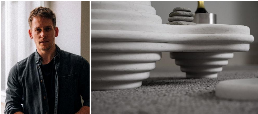
Abb. 4-5: Simon Hirtz von A.I.gency gestaltete in Schichtbauweise einen monolithischen, organisch geformten Couchtisch aus Silestone White Arabesque.